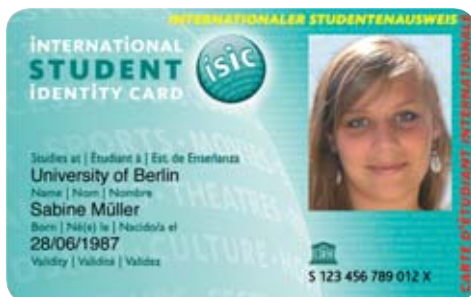
Sinnvolle Reisebegleitung – der ISIC

Reisefreudige Studierende sollten sie ihr Eigen nennen. Die International Students Identity Card, kurz ISIC. Mit dem internationalen Ausweis erhalten sie Ermäßigungen in über 120 Ländern rund um den Globus. Von günstigen Flügen über verbilligte Unterkünfte bis hin zum ermäßigten Eintritt in führende Museen und Theater. Erhältlich in der Abteilung Beratung und Service des Studentenwerks, Gießen: Otto-Behaghel-Straße 25 (Raum 18), Fulda: Daimler-Benz-Straße 5a. Friedberger Studierende wenden sich bitte an das Büro in Gießen.