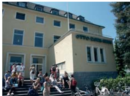
Voraussichtlich ab Oktober wieder geöffnet – die Mensa Otto-Eger-Heim

Die Mensa Otto-Eger-Heim des Studentenwerks Gießen wird in den nächsten beiden Jahren von Grund auf saniert. Eine komplett neue Küche und ein Geschirrrückgabe- und -spülsystem der jüngsten Generation sind die